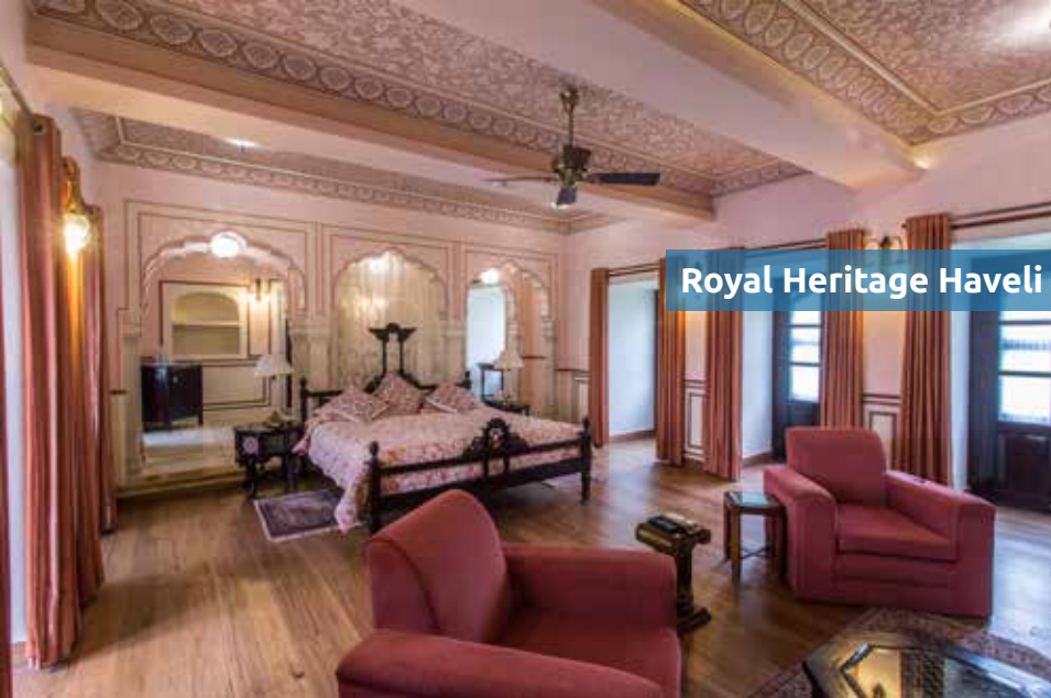
Royal Heritage Haveli