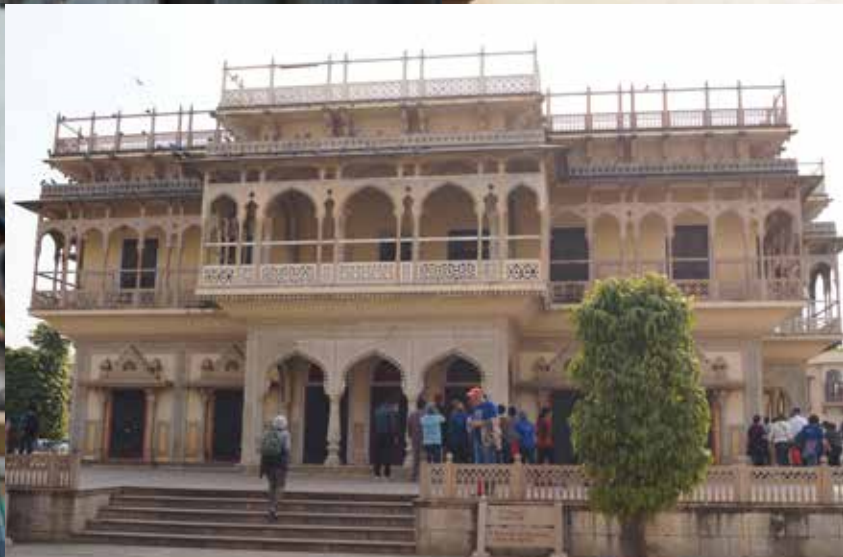
Indien Impressionen Jaipur